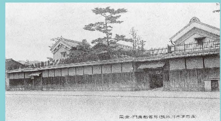
吉川旅館(本通1丁目)

呉の宿は、ビジネスホテルが多く「玄関からのご案内付き」という一般的なイメージする「旅館」は非常に少ないのです。理由としては、呉の歴史が大きく関係しています。戦前、巨大な海軍工廠を抱えた呉では多くの料亭付きの高級旅館がブイブイいわせていましたが、戦後は海軍工廠を失い、高級旅館は姿を消していきます。しかし、海軍工廠で培われた技術を引き継いだ造船所や鉄鋼所など、民間の重工業を中心に発展。同時に宿の利用はビジネス客、製造業の関連企業の長期滞在利用が中心になりました。戦後の呉の宿は現在に至るまで「働く人」を多く受け入れてきたのです。